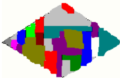
Het multiculturele mozaïek

De interculturele samenleving is als het ware een schaal met 16 miljoen losse knikkers: geen één is exact hetzelfde, ook al zijn er bepaalde kleurgroepen en afmetingen te onderscheiden. De knikkers liggen los en kunnen voortdurend bewegen tussen alle andere knikkers. In tegenstelling tot het statische mozaïek van de multicultuur, is de interculturele samenleving een dynamisch geheel: steeds verrassend, vaak ook confronterend, maar zelden geneigd tot een kil laisser faire .